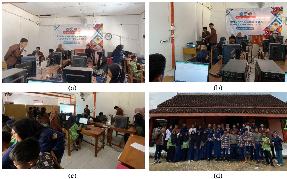
Gambar 2. (a)(b)(c) Kegiatan Pelatihan, (d) Foto Bersama Dengan Peserta Pelatihan

Hasil pelatihan siswa mampu mengoperasikan MS Word , MS Excel , dan MS Power Point yang mana sebelumnya siswa belum pernah mengoperasikan Microsoft Office . Pelatihan juga menghasilkan modul praktikum yang dapat digunakan oleh siswa untuk meningkatkan keterampilan, serta meningkatkan minat belajar siswa dalam penggunaan komputer atau literasi digital.