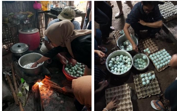
Gambar 3. Proses Pengukusan Telur

Perendaman dilakukan selama 14 hari, hal ini bertujuan agar garam bisa meresap secara maksimal ke dalam telur. Setelah masa tunggu perendaman sudah mencapai 14 hari maka telur siap memasuki proses selanjutnya. Telur diambil dari ember secara perlahan agar tidak pecah maupun retak, kemudian telur harus dicuci dengan air mengalir dengan cermat agar sisa - sisa media perendaman hilang sepenuhnya. Tahap berikutnya adalah pengukusan, waktu yang diperlukan untuk mengukus telur asin baik dalam jumlah besar maupun kecil adalah 2 jam. Rentang waktu ini sudah tepat agar telur tidak pecah dan kandungan gizinya tidak hilang. Terakhir sebelum dikemas, telur asin dicelupkan ke dalam larutan air yang telah dicampur dengan tawas, hal ini dimaksudkan agar saat nantinya saat telur dijual tidak akan mudah kotor karena telah dilapisi oleh larutan tawas pada cangkang telurnya.