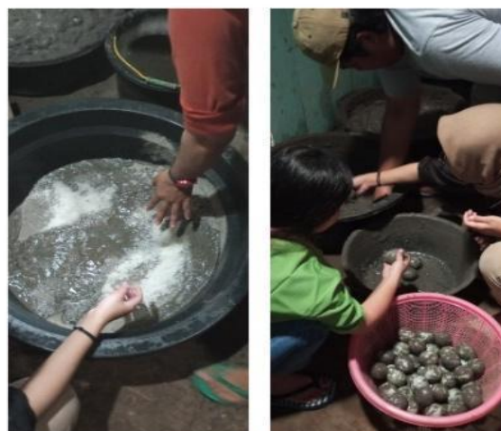
Gambar 2. Proses Perendaman Telur

Proses selanjutnya adalah pembuatan media perendaman dengan bahan campuran abu bekas kayu bakar yang telah disaring, garam kasar/krosok, dan air dengan perbandingan antara abu dengan garam kasar yaitu 2:1 (setiap 2 kilogram abu harus dicampur dengan 1 kilogram garam kasar). Ketika mencampurkan abu dengan garam kasar, air harus di masukkan secara perlahan hingga media perendaman memiliki tingkat kekentalan yang sesuai, hal ini dimaksudkan agar media perendaman dapat masuk ke celah - celah telur yang sudah ditata sedemikian rupa di dalam ember yang telah dipersiapkan.