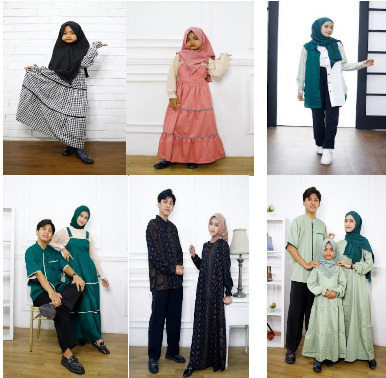
Gambar 1. Dokumentasi Produk Konnuku