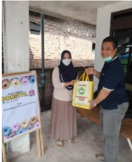
Gambar 5. Dokumentasi Penarikan Mahasiswa dari Lokasi KKU