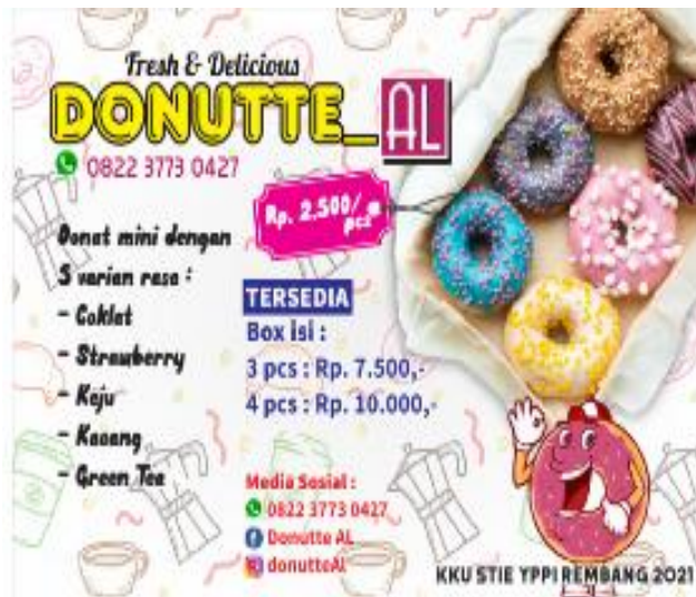
Gambar 3. Brosur UMKM Donutte_AI

Proses pembuatan brosur dan pencetakan brosur juga merupakan tahapan penting dalam strategi marketing untuk menyebarkan informasi yang menarik dan informatif kepada calon pelanggan. Pada tahap ini, desain brosur yang telah disiapkan direalisasikan menjadi bentuk cetak. Proses pembuatan brosur dan pencetakan brosur UMKM dapat menjadi sarana yang efektif dalam menarik perhatian dan memperkenalkan produk atau layanan UMKM kepada pasar yang lebih luas, serta memberikan informasi yang lebih detail seperti detail produk yang ditawarkan, variasi produk yang ditawarkan, kontak UMKM yang dapat dihubungi serta informasi detail tambahan yang lain. Brosur UMKM Donutte_AI disajikan pada Gambar 3.