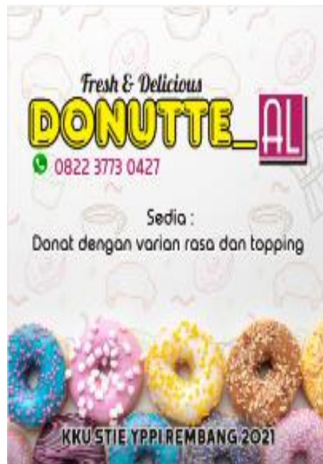
Gambar 2. Papan Banner UMKM Donutte_Al

Pemaparan program kerja Kuliah Kerja Usaha (KKU) merupakan langkah kunci dalam merencanakan dan mengelola aktivitas yang berkaitan dengan pengembangan bisnis UMKM mitra. Pada tahap ini, diuraikan dan dijelaskan secara rinci program kerja yang akan dilaksanakan untuk mencapai tujuan bisnis yang diharapkan. Program kerja KKU mencakup berbagai aspek, seperti strategi pemasaran, pengembangan produk atau layanan, dan dibuatkannya surat perizinan berusaha. Dengan pemaparan program kerja yang jelas, anggota KKU dapat memahami tanggung jawab masing-masing, mengidentifikasi risiko dan peluang yang mungkin muncul, serta merencanakan langkah-langkah konkret untuk mencapai kesuksesan UMKM mitra, serta menjadi fondasi bagi kesinambungan dan pertumbuhan bisnis yang berkelanjutan.