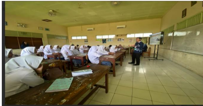
Gambar 4. Pembelajaran Materi Kepemimpinan

dapat pula berarti menunjukkan jalan yang baik atau benar, tetapi dapat pula berarti mengepalai pekerjaan atau kegiatan. Kepemimpinan dapat pula didefinisikan sebagai seni mempengaruhi dan mengarahkan orang dengan cara kepatuhan, kepercayaan, kehormatan, dan kerjasama yang bersemangat dalam mencapai tujuan bersama (Putranto, 2020).