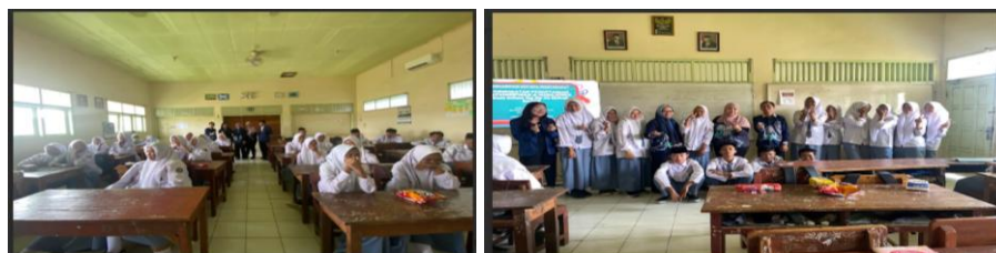
Gambar 1. Foto Kegiatan