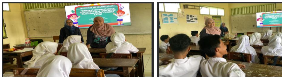
Gambar 6. Tanya Jawab dan Diskusi

Pada sesi tanya jawab dan diskusi, peserta sangat antusias bertanya mengenai kepemimpinan dan manajemen. Salah satu peserta bertanya mengenai bagaimana menasehati seorang pemimpin yang tidak berkoordinasi dan tidak mau tahu mengenai kegiatan yang diadakan.