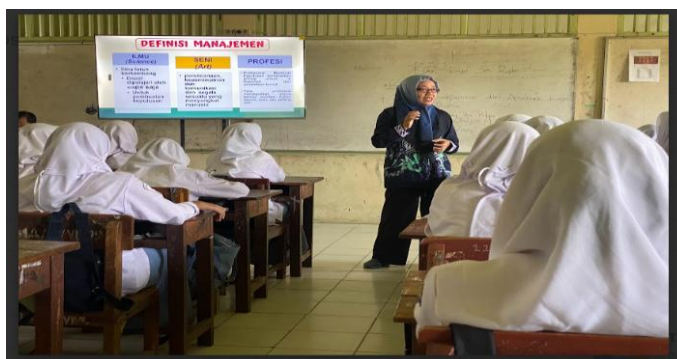
Gambar 5. Penyampaian Materi Manajemen

Sedangkan manajemen adalah suatu proses atau kerangka kerja, yang melibatkan bimbingan atau pengarahan suatu kelompok orang-orang kearah tujuan-tujuan organisasional atau maksud-maksud yang nyata (Putranto, 2020).