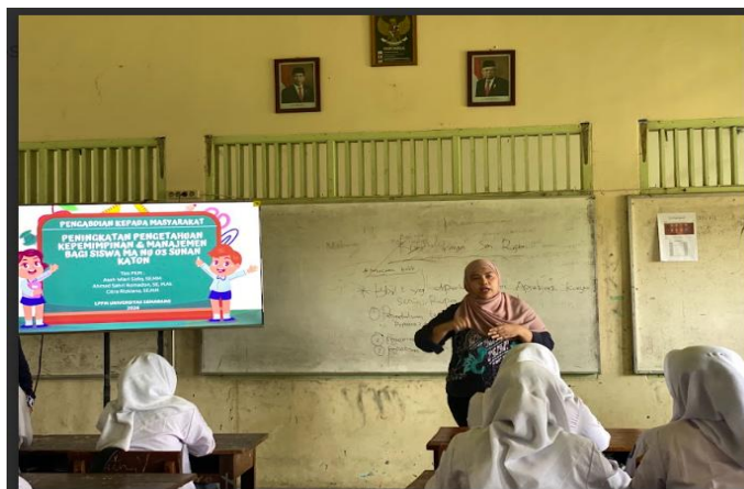
Gambar 3. Foto Pembukaan Kegiatan PKM

Pelaksanaan kegiatan diawali dengan pengenalan tim pengabdian kepada peserta pengabdian yaitu pengurus OSIS MA NU 03 Sunan Katong Kaliwungu dan ramah tamah, kemudian memberikan informasi mengenai maksud dan tujuan melakukan pengabdian mengenai peningkatan pengetahuan kepemimpinan dan manajemen. Setelah peserta mengerti maksud dan tujuan tim dilanjutkan pemberian peningkatan pengetahuan kepemimpinan dan manajemen berupa penyampaian materi, tanya jawab dan diskusi.