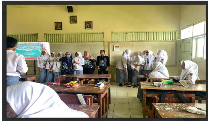
Gambar 2. Foto Kegiatan

Kegiatan Pengabdian Kepada Masyarakat telah dilaksanakan di ruang kelas IPS 1 MA NU 03 Sunan Katong Kaliwungu pada hari laboratorium Akuntansi SMK Negeri 9 Kota Semarang pada hari Selasa, 14 Mei 2024 jam 10.00 – 12.00 WIB dengan jumlah peserta 27 siswa.