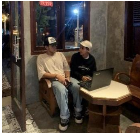
Gambar 1. Pemberian Pengarahan Kepada Kepala Bar De Vijas

Hasil yang diperoleh pengabdian Masyarakat dijabarkan beberapa aspek yakni: Pada fase persiapan, pemilik kedai memberikan respons positif yang mengapresiasi dan mendukung kelancaran pelaksanaan acara ini. Pemilik Kedai memberikan waktu dan tempat untuk dilaksanakannya kegiatan pengabdian masyarakat ini. Selain itu, pemilik Kedai juga mengarahkan kepada Kepala bar untuk mengikuti kegiatan ini dengan baik. Berikut merupakan gambaran pelaksanaan kegiatan pengabdian masyarakat di Kedai De Vijas.