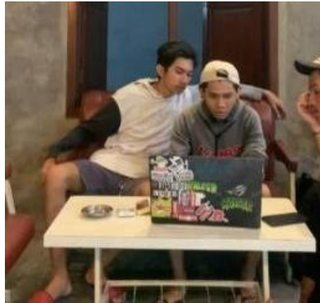
Gambar 3. Pelatihan Penggunaan website linktree

Pada gambar 3 tim pengabdian masyarakat memberikan pelatihan kepada seluruh pegawai terkait penggunaan website linktree pada tanggal 31 Mei hingga 4 Juni 2024.