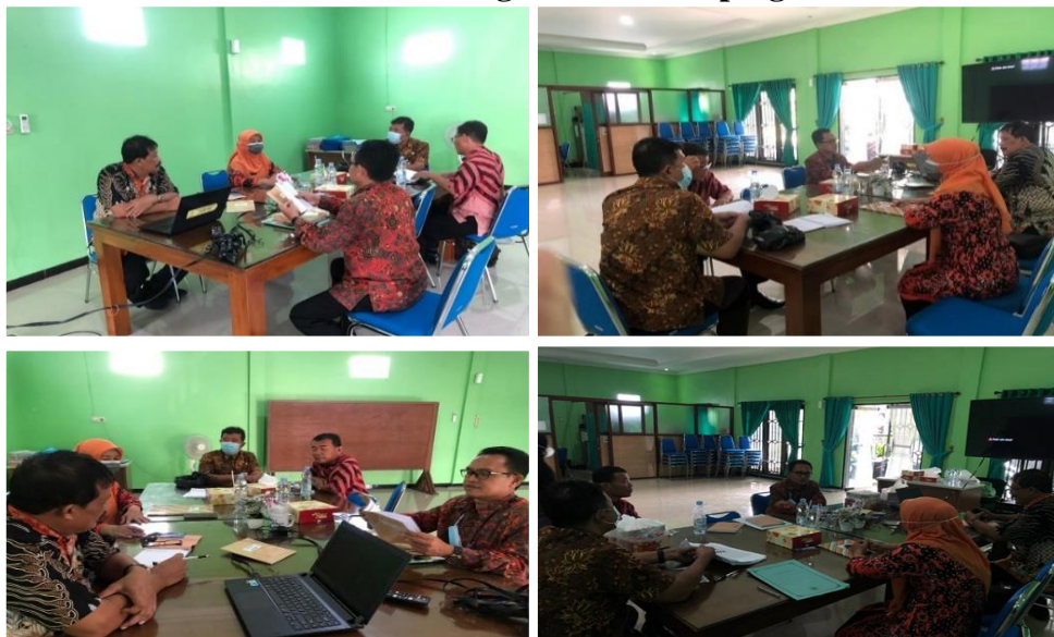
Gambar 9. Foto Kegiatan Pendampingan