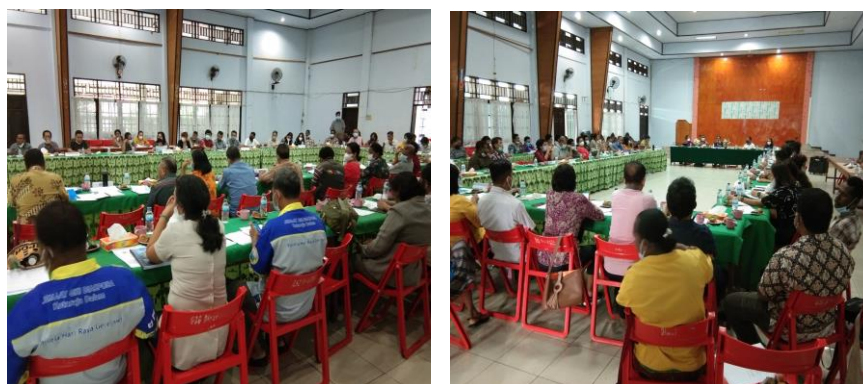
Gambar 2. Identifikasi Masalah Pengelolaan Keuangan

Kegiatan pengabdian ini dilaksanakan pada tanggal 06 Mei sampai dengan 31 Desember 2022. Adapun tahapan yang dilakukan dalam pelaksanaan pendampingan ini yaitu pengamatan yang dilakukan kepada para pemegang kas Urusan, Unsur, Rayon, Pengelola GSG, dan Sekolah TK jemaat GKI Diaspora Kotaraja selama satu bulan kemudian melakukan FGD mengenai permasalahan dan kendala yang dihadapi dalam pengelolaan keuangan.