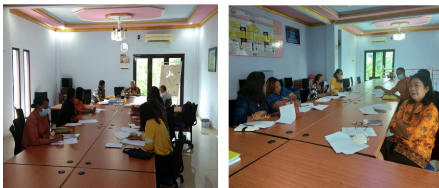
Gambar 3. Pemaparan Materi

TK di jemaat GKI Diaspora Kotaraja. Tim PkM memberikan pelatihan tentang pengelolaan keuangan yang dilanjutkan dengan pembagian tugas pelaksanaan pendampingan. Kegiatan dengan tema Pendampingan pengelolaan keuangan pada jemaat GKI Diaspora Kotaraja ini diselenggarakan pada tanggal 06 Mei 2022. Kegiatan berlangsung dari pukul 09.00 sampai 12.00 WIT.