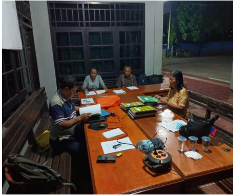
Foto Kegiatan Pendampingan