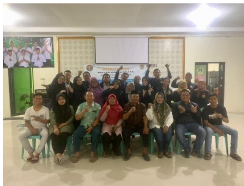
Gambar 4. Pelatihan Knowledge Skill untuk Pengelola Wisata (BUMDes dan Karang Taruna)