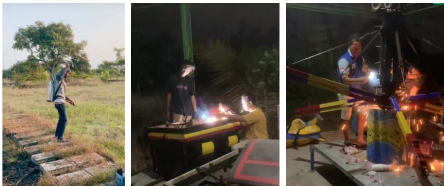
Gambar 2. Pembersihan lahan dan perbaikan mesin wahana wisata

Untuk permasalahan terbengkalainya rencana wisata Taman Bunga Matahari, tim melakukan revitalisasi objek wisata dengan metode penataan desain dan destinasi wisata. Bersama tim pengelola dari BUMDes, tim KKN Tematik menata rencana wisata yang awalnya sebagai lahan budidaya bunga matahari dan tempat swafoto, menjadi tempat eduwisata dan outbond. Adapun hal yang dilakukan yaitu dengan (1) Memperbaiki mesin wahana wisata, (2) Mengoperasikan panel surya sebagai penghemat listrik. (3) Membuat wahana untuk outbond, (4) Menyusun penganggaran untuk penataan desain dan destinasi wisata. Adapun kendala yang dihadapi yaitu kurangnya transparansi BUMDes terkait perencanaan proyek wisata dan tidak adanya sosialisasi dengan BUMDes terkait perencanaan proyek wisata.