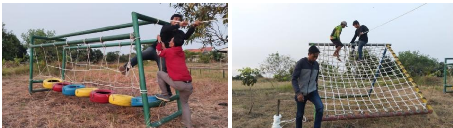
Gambar 3. Pembuatan sarana outbond