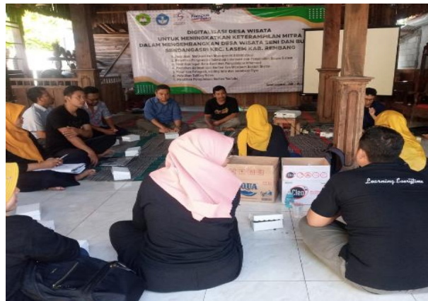
Gambar 3. Pelatihan Motivasi dan Manajemen

Bahkan pada tahap akhir pelatihan dibuatkan sesi diskusi secara khusus terkait peningkatan kinerja organisasi maka diperlukan Standar Operasional Prosedur dalam manajemen organisasi Desa Wisata. Hal ini penting karena Standar Operasional Prosedur tersebut dimaksudkan sebagai pedoman atau acuan pengelola Desa Wisata untuk melaksanakan tugas pekerjaannya. Nantinya SOP juga dapat digunakan sebagai alat penilaian kinerja pengelola desa wisata.