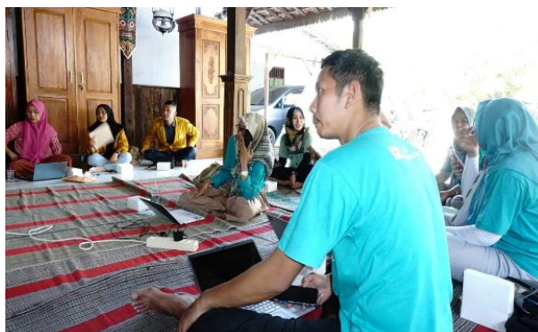
Gambar 2. Observasi dan diskusi Tim Pengabdian Bersama Mitra

Observasi ini bertujuan untuk mempelajari kondisi lingkungan di Desa Sendangasri, karakter masyarakat dan pengelola Desa wisata, serta melakukan koordinasi dengan perangkat desa. Hasil observasi dianalisis oleh Tim Pengabdian bersama dengan pengelola desa wisata untuk mengidentifikasi permasalahan yang harus segera ditangani. Dari tahapan ini disetujui permasalahan kurangnya pengetahuan pengelola Desa Wisata Seni dan Budaya Sendangasri dalam manajemen pariwisata sehingga berdampak pada belum maksimalnya kinerja organisasi desa wisata. Selanjutnya, berdasarkan permasalahan yang disimpulkan ditetapkan solusi untuk penanganannya yaitu peningkatan kinerja organisasi desa wisata.