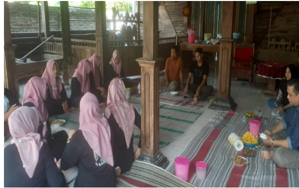
Gambar 4. Pendampingan oleh Tim Pengabdian

prosedur yang baku sesuai dengan ketentuan yang berlaku dan dilaksanakan secara efektif, efisien serta tepat sasaran. SOP Surat Masuk pada intinya memuat petunjuk operasional pengelolaan surat masuk serta bagan alur prosedur. SOP Surat Keluar dimaksudkan sebagai pedoman pengelola desa wisata dalam menangani/mengadministrasikan surat keluar sehingga terdapat proses dan prosedur yang baku sesuai dengan ketentuan yang berlaku serta dilaksanakan secara efektif, efisien dan tepat sasaran. SOP Surat Keluar pada intinya memuat petunjuk operasional pengelolaan surat keluar serta bagan alur prosedur.