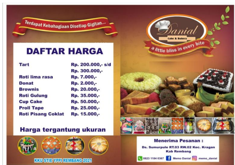
Gambar 3 Brosur

Hasil kegiatan pembuatan brosur adalah UMKM sudah mempunyai brosur untuk dibagikan kepada konsumen.