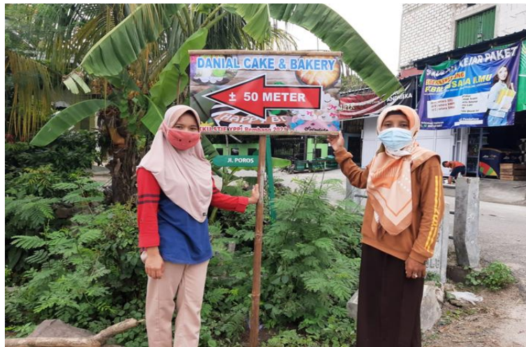
Gambar 2 Pemasangan Petunjuk Arah

Hasil kegiatan pembuatan papan petunjuk arah adalah sudah terpasang petunjuk arah tersebut.