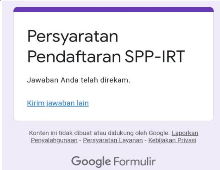
Gambar 5 Pendaftaran PIRT Online

Hasil kegiatan pendaftaran PIRT adalah UMKM Danial Cake & Bakery sudah terdaftar.