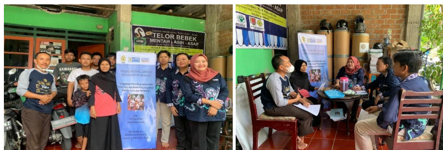
Gambar 2. Pelaksanaan PkM

Kegiatan pengabdian kepada masyarakat ini dilaksanakan di jalan Cemara Indah XI Blok C2 No 53 Bukit Kencana Jaya Semarang. Acara dimulai pada pukul 11.00 dibuka dengan pembukaan oleh Ketua PKM, dilanjutkan dengan sambutan penerimaan oleh pemilik bisnis, penjelasan riwayat usaha dan proses produksi, kemudian diskusi dan sharing dan diakhiri dengan foto bersama seluruh tim dan pemilik usaha dan pekerja.