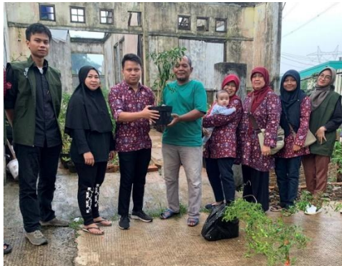
Gambar 2. Penyerahan Tanaman TOGA secara simbolis kepada mitra

Masyarakat mitra sebelumnya juga telah menyiapkan dan menanam beberapa tanaman obat pada lahan apotek hidup. Adapun alat dan bahan lainnya telah disiapkan baik oleh tim dan mitra meliputi: pupuk, media tanam, name tag TOGA (Gambar 3), dan perlengkapan budidaya (cangkul, garu, selang, sprayer , dan gunting).