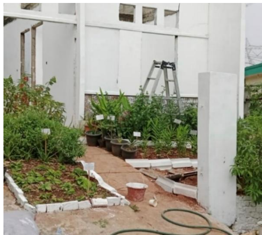
Gambar 4. Potret tanaman yang sudah ditanam dan dipasangkan name tag pada apotek hidup

Masyarakat mitra meminta tanaman-tanaman yang diberikan tersebut tidak hanya ditanam di area Apotek Hidup, namun juga disebar di beberapa titik di lingkungan tersebut. Hal ini dimaksudkan agar lingkungan RT lebih hijau dan seluruh masyarakatnya juga dapat merasakan manfaat dari tanaman TOGA ini.