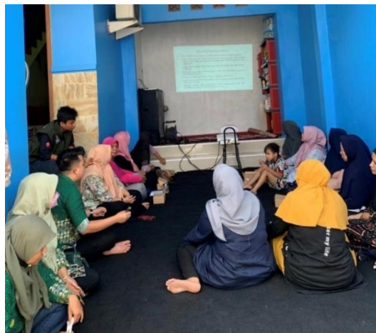
Gambar 1. Sosialisasi Pengenalan TOGA dan Apotek Hidup