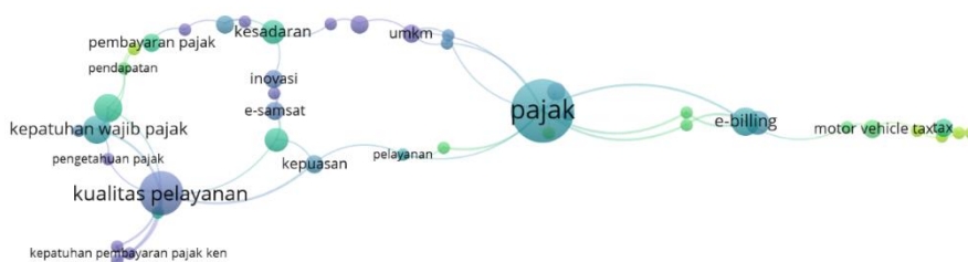
Gambar 2 : Overlay Visualization

Kata spesifik “kualitas pelayanan” muncul dalam visualisasi yang menunjukkan bahwa penulis sebelumnya mengerucutkan penelitian pada subjek “kualitas pelayanan”. Hal ini dikarenakan “kualitas pelayanan” merupakan faktor yang mendukung wajib pajak dalam membayar pajak, dan kualitas pemerintah dalam memberikan pelayanan pembayaran pajak juga menjadi perhatian penting bagi wajib pajak dalam membayar pajak.