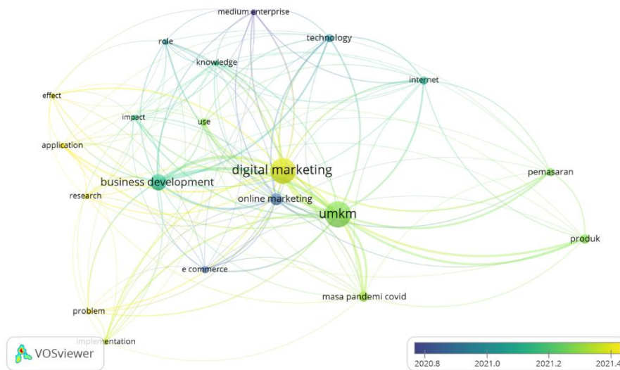
Gambar 2. Peta Perkembangan Publikasi berdasarkan Hasil Overlay Visualization

kemudahan kepada peneliti untuk menganalisis kata kunci yang sering keluar dan dipakai dengan tema artikel yang sama.